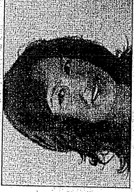
Il ministro Mariastella Gelmini