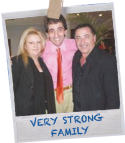
VERY STRONG FAMILY