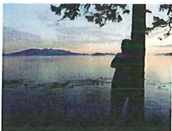
relatori di Modena.

Sarà dedicato specificamente agli adulti con autismo il convegno del 5 febbraio a Modena - promosso dal Distretto Lions 108Tb, insieme all'ANGSA (Associazione Nazionale Genitori Soggetti Autistici) - ove verranno presentate esperienze, testimonianze e buone prassi, che finalmente dovrebbero diventare "sistema", in un ambito ancora sin troppo trascurato nel nostro Paese. Nello stesso giorno, invece, servirà soprattutto a presentare un nuovo Gruppo Famiglie Autismo il convegno di Andria, voluto dall'Associazione Camminare Insieme, con la consapevolezza che l'autismo e i disturbi generalizzati dello sviluppo vanno via via interessando sempre più bimbi e famiglie sul territorio pugliese