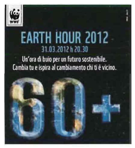
Earth Hour 2012

Earth Hour 2012 è alle porte: questa sera, sabato 31 marzo, dalle 20.30 alle 21.30, cittadini, Comuni, Scuole ed Istituzioni daranno vita all'evento mondiale che nel 2011 ha coinvolto quasi 2 miliardi di persone, con 135 Paesi e circa 5.200 città partecipanti.