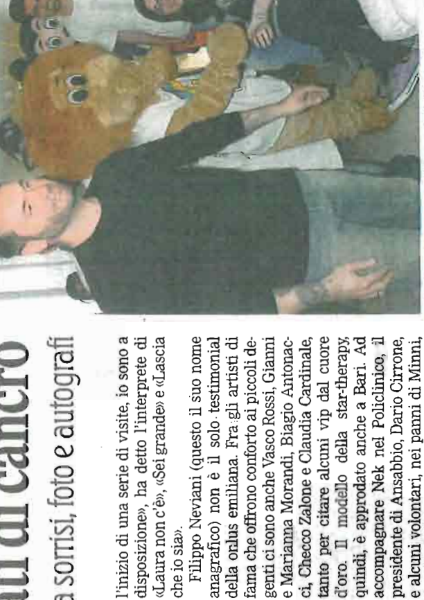
STAR IN REPARTO Nek ai Policlinico

«Niguarda» di Mila. Da ieri, anche nel Policlinico di Bari: «Potrebbe essere Ansabbio, in effetti, è costantemente presente nel «Rizzoli» di Bologna (dove esiste un reparto di 12 posti letto per i bambini che si sottopongono alla chemioterapia per curare il cancro) e nel