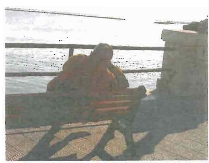
DISTESA ALCOLICA Etilista sognante sul Lungomare di Bari