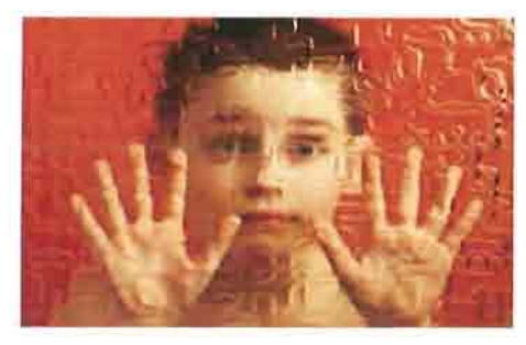
1 aprile giornata mondiale autismo

Domenica 1 aprile, in occasione della Giornata Mondiale dell'Autismo l'Associazione Nazionale dei Genitori Soggetti Autistici (ANGSA) sarà presente in Puglia a Bari - Largo 2 Giugno (ingresso principale); Monopoli - P.zza Vittorio Emanuele; Barletta - C.so Vittorio Emanuele per distribuire materiale informativo sulla sindrome autistica e sul suo trattamento.