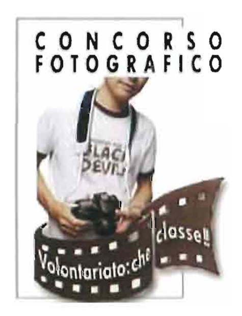
La locandina dell'iniziativa promossa dal CSV San nicola di Bari

Telefono» 080 5640817 - 080 5648857 (Area comunicazione)