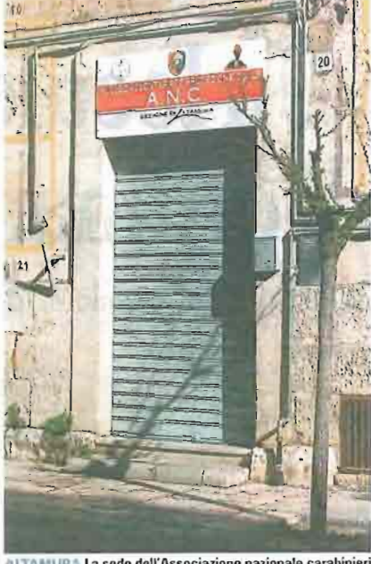
ALTAMURA La sede dell'Associazione nazionale carabinieri