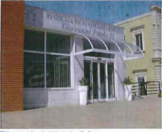
L'ingresso della sede del Centro risvegli a Capurso

La struttura è pronta a partire: un'equipe di medici specializzati già effettua prestazioni ambulatoriali per i malati meno gravi che vengono seguiti con i macchinari più avveniristici.