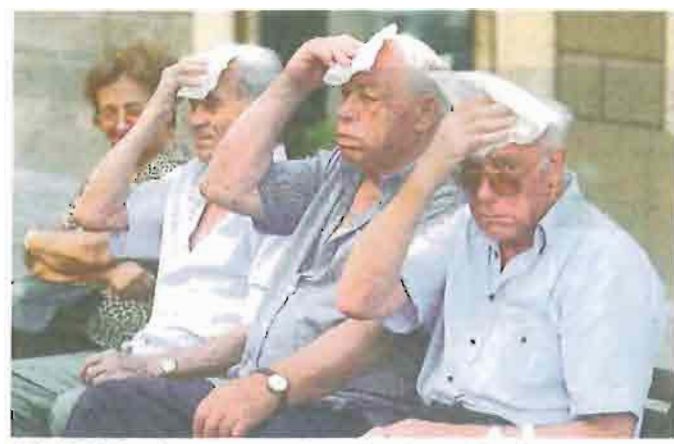
ANZIANI Con l'estate aumentano disagi e problemi

Tresi nella rete", è l'iniziativa promossa dall' Auser Puglia, l'associazione di volontariato impegnata a promuovere l'invecchiamento attivo degli anziani per formare nuovi giovani volontari. Una "cassetta degli attrezzi" per fare volontariato in maniera qua-