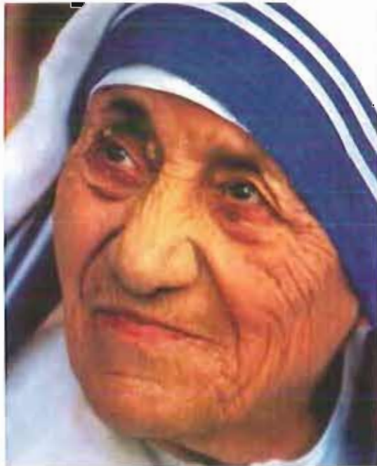
Madre Teresa