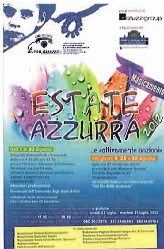
La locandina di "Magicamente Estate Azzurra 2012"

In collaborazione con: Associazione Italiana Assistenza Spastici Associazione Nazionale Tumori Associazione Tutela Salute Mentale "Speranza" Autismo Insieme Club Femminile dell'Amicizia Federazione Pugliese Donatori Sangue Sez. di Santeramo Prometeo-Associazione Genitoriale Pubblica Assistenza Murgia Soccorso Volontariato Vincenziano