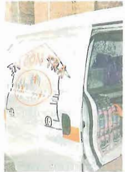
ACQUA PER TUTTI Il furgone attrezzato