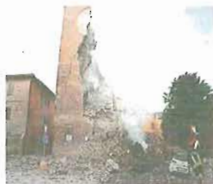
I danni del sisma in Emilia Romagna