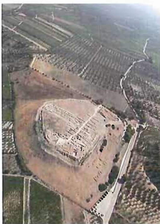
Canne della Battaglia

Ospite d'onore una rappresentanza in costume d'epoca del Gruppo storico Medella della Scuola Media Statale Foscolo Marconi di Canosa di Puglia: come vestivamo ai tempi di Annibale e delle Guerre Puniche.