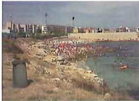
La Prima Cala