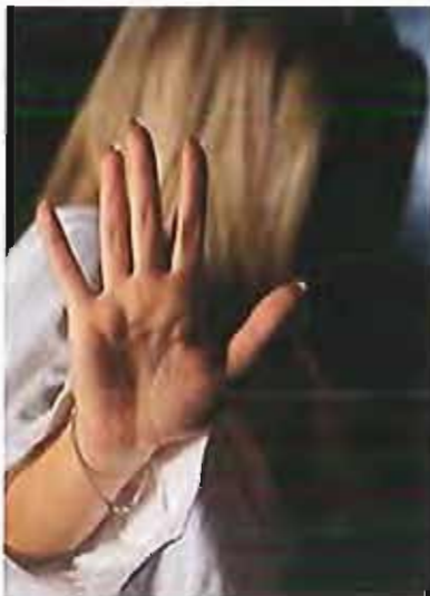
Violenza donne