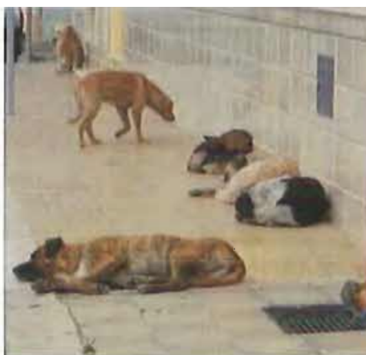
Un branco di randagi

Attualmente sono in corso le indagini di polizia giudiziaria per l'individuazione del responsabile. Rischia una pena sino a due anni di carcere.