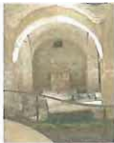
SUCCORPO Sotto la Cattedrale