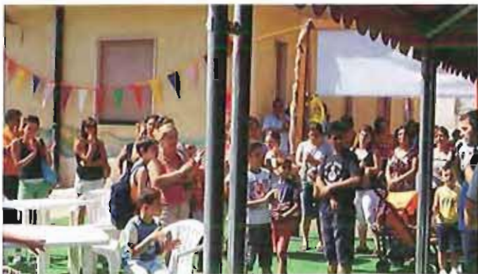
Un Lido per tutti Un momento dell'inaugurazione

M ichele ha una certa dimestichezza con i sogni. Sa che farli è bello. E lo è ancor di più, se a sognare si è in tanti.