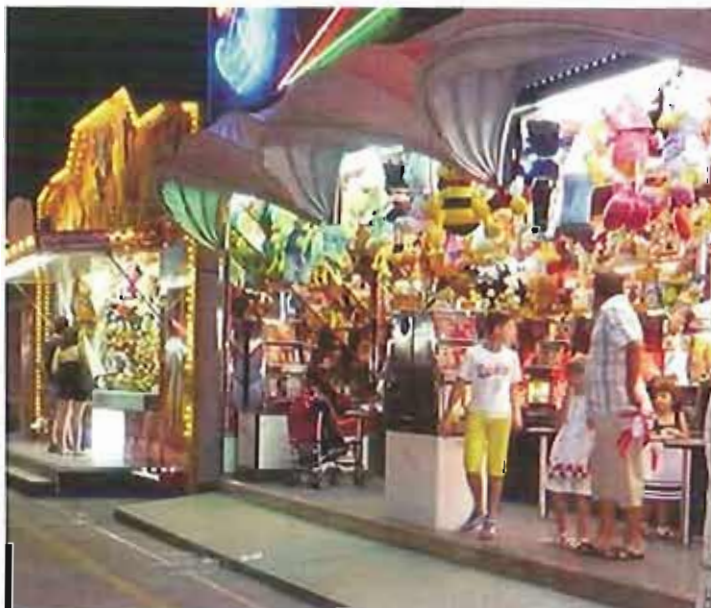
Luna Park3

Un appuntamento non nuovo in città, ma che ha un alto valore simbolico, in occasione della Festa patronale. «Poter dare delle ore di allegria e spensieratezza, vedere un sorriso da parte di chi nella vita è stato meno fortunato di tutti noi è una cosa che riempie di felicità e rende orgogliosi», ha sottolineato l'assessore allo Sport e Turismo, Fabrizio Sotero, ispiratore dell'appuntamento.