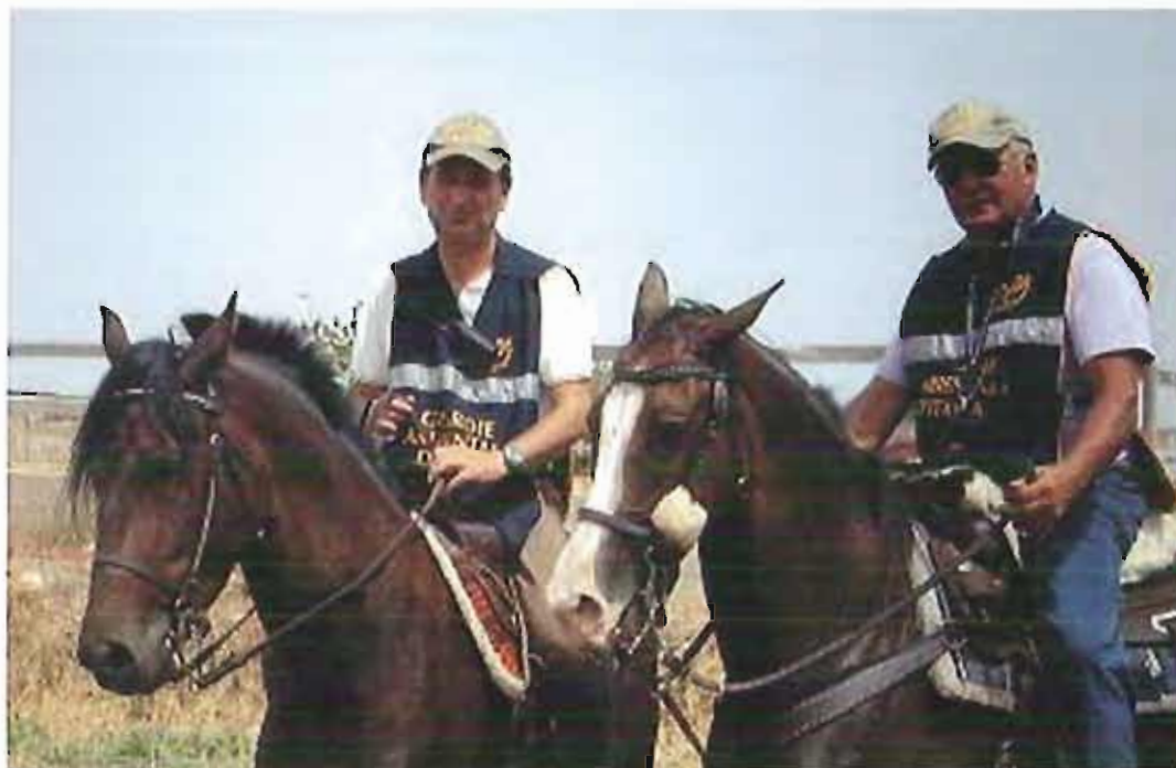
Guardie ambientali a cavallo