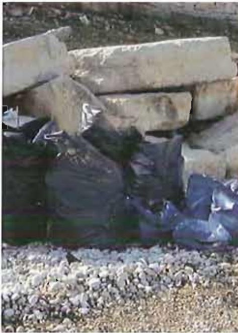
"Mare d'Inverno" di Fare Verde Bisceglie

Ma ci chiediamo, una volta terminato il campo, anche quest'anno nessuno si prenderà cura dell'unico vero polmone verde di Bitonto?