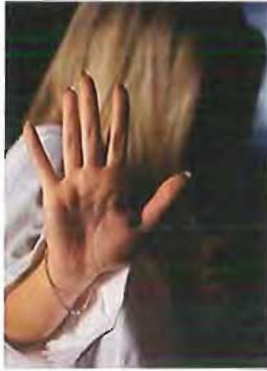
Violenza donne