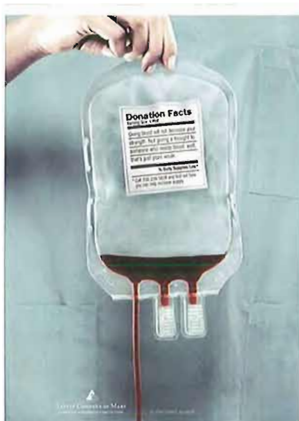
Donazione sangue