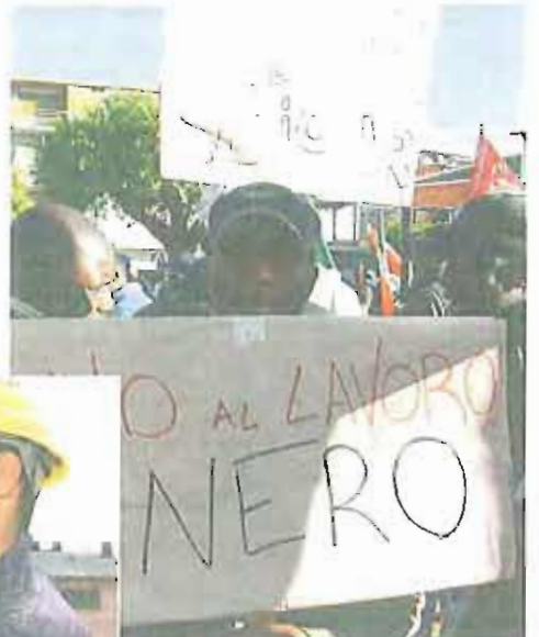
SFRUTTATI Gli immigrati irregolari sono costretti a sottostare alle regole del lavoro nero

Per regolarizzare bisognerà pagare un contributo forfettario di 1.000 euro per ciascun lavoratore; a ciò dovranno aggiungersi le somme dovute dal datore di lavoro a titolo retributivo, contributivo e fiscale pari ad almeno sei mesi (fatto salvo l'obbligo di regolarizzazione le somme dovute per l'intero periodo in caso di rapporti