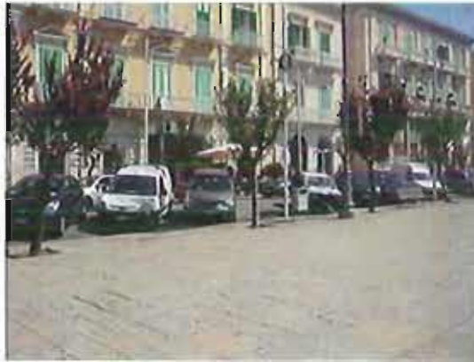
Piazza Vittorio Emanuele II

«Lo scopo di questo progetto - si legge in una nota - è offrire una struttura ricettiva che accolga le famiglie bisognose provenienti da luoghi distanti, che hanno necessità di un posto letto o di una sistemazione temporanea in cui sostare, nei periodi di trattamento terapeutico dei loro bambini».