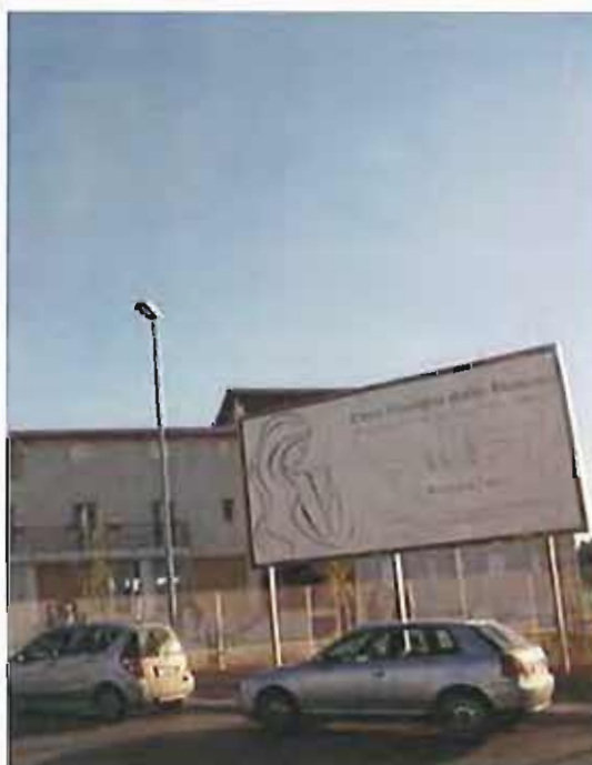
La Casa famiglia della mamma

L'intero ricavato è stato devoluto per il completamento della nuova struttura divenuta operativa di recente. Un gesto davvero molto apprezzato dalla Comunità Educativa.