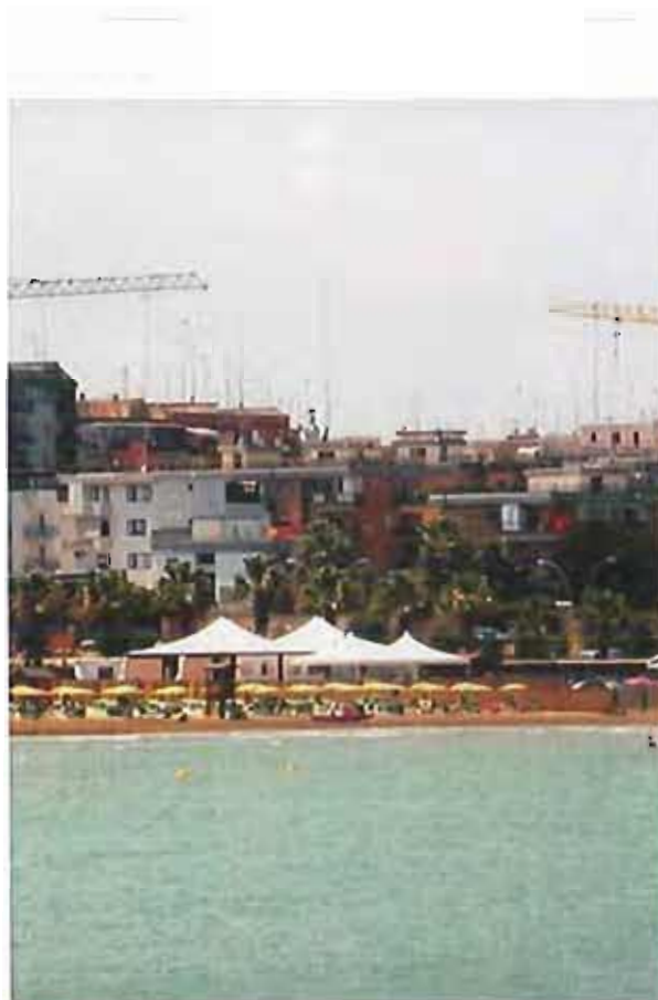
Litoranea di ponente

L'Associazione Avser di Barletta, inoltre, garantisce l'innovativo servizio di idroambulanza con soccorritori-sommozzatori e il pattugliamento di un "Quad", moto da sabbia, per aumentare il livello di sicurezza.