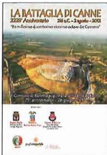
Celebrazione 2228° Anniversario della Battaglia di Canne

Si ringraziano gli Sponsor per la collaborazione.