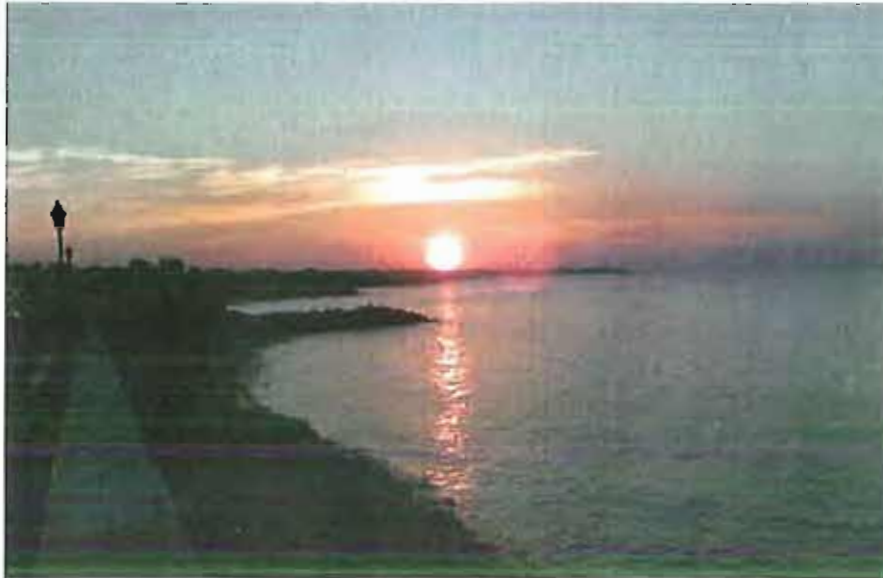
lungomare paternostro bisceglie

Il progetto di ZonaEffe a tutela dell'ambiente marino biscegliese