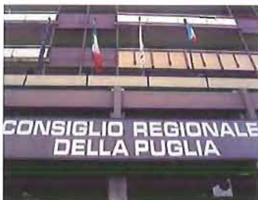
Consiglio Regione Puglia