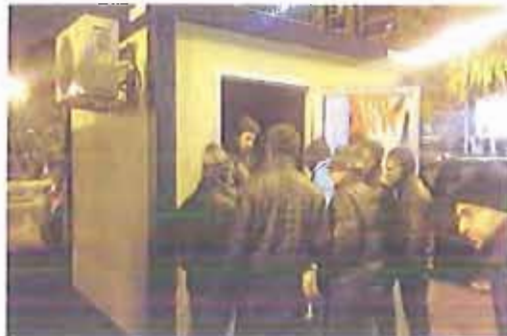
■ La postazione del Caps in piazza Moro davanti alla stazione