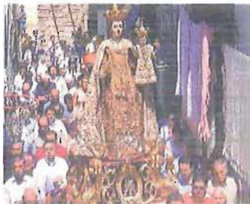
La processione della Madonna del Carmine