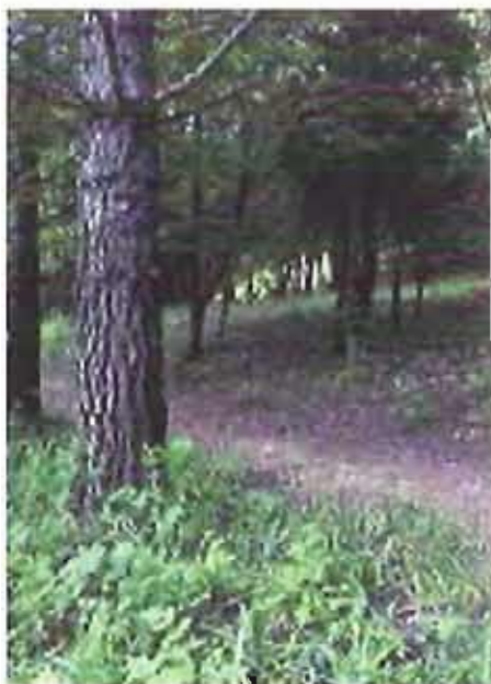
Uno scorcio del Bosco di Bitonto

Fare Verde invita tutti a passare qualche giorno con i volontari. E' l'occasione per vivere un'esperienza a contatto diretto con la natura, e per coglierne i significati più profondi.