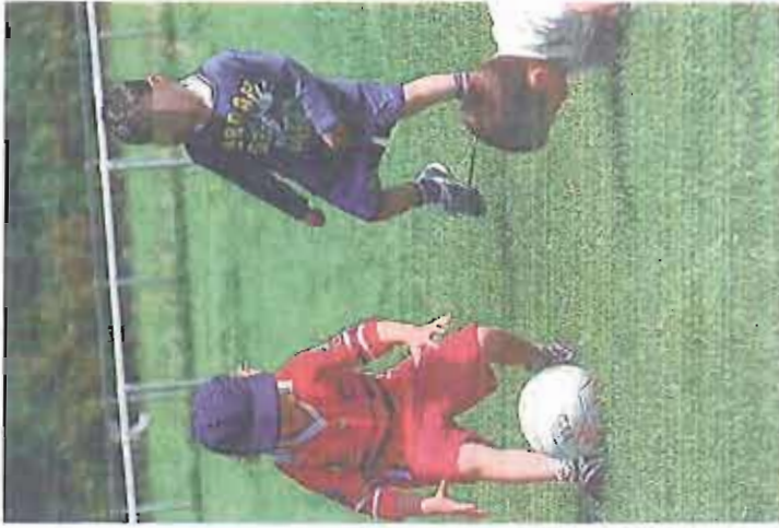
CAPURSO Campi scuola per i bambini

La domanda di iscrizione potrà essere scaricata dal sito istituzionale o ritirata presso gli uffici del Segretariato sociale e consegnata entro il 18 luglio all'ufficio Protocollo, insieme con la richiesta di pagamento da eseguire all'ufficio Economato. Nel caso gli iscritti superassero il numero di 50, l'ordine di priorità sarà dato a quelli seguiti dai Servizi sociali o dal Tribunale e ancora dall'ordine di arrivo della domanda.