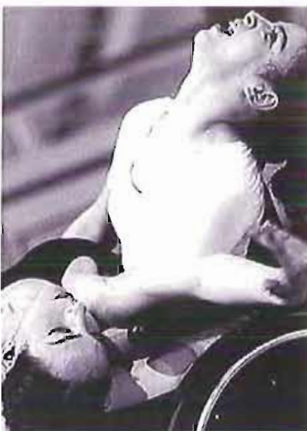
Teatro per persone con disabilità o fragilità

TEATR-ABILITÀ - Laboratorio di teatro dell'oppresso con spettacolo a cura di Teatro degli Adriani - Fattoria degli Artisti - Associazione ASILIS