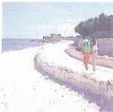
La spiaggia di Torre Gavetone

■ Si chiama «Estate sereni» ed è l'iniziativa, targata SerMolfetta, che a partire da questo weekend garantirà il servizio di assistenza sanitaria gratuito su tutto il litorale fino ad agosto incluso. «Figure professionali qualificate - puntualizzano i promotori dell'iniziativa - assicureranno assistenza ai bagnanti in difficoltà a bordo di una moto e di un'auto medica, per garantire la massima tempestività in caso di malori, traumi o sindromi da annegamento. Ogni unità operativa sarà equipaggiata