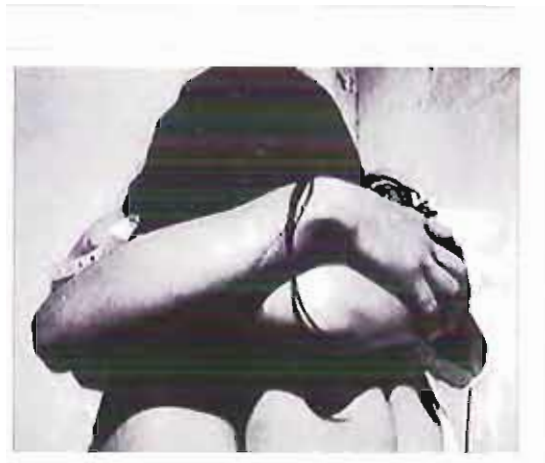
Fermiamo il femminicidio n.c.

La città di Bari e l'assessorato al Welfare stanno facendo rete sul contrasto al femminicidio e sull'educazione alla sessualità e al rispetto della persona, ma non basta. Bisogna che vengano individuati fondi ministeriali, regionali e comunali dei vari settori che riguardano scuola, sanità e sociale per avviare progetti formativi ed educativi destinati in particolare agli adolescenti, affinché la cultura della sessualità e del rispetto del corpo proprio e altrui risulti vincente. La Persona e la Famiglia devono essere al centro della salute sociale".