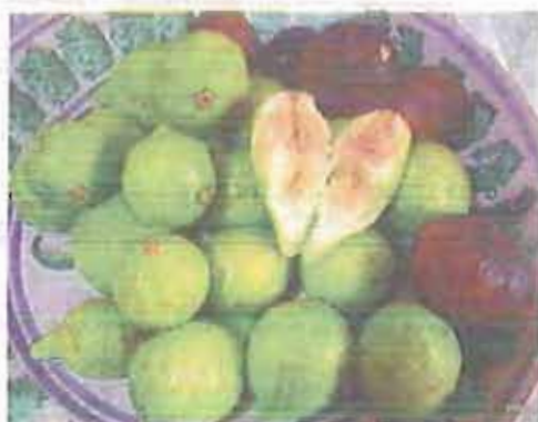
FRUTTI I fioroni distribuiti alle famiglie in difficoltà

Nel corso della campagna di raccolta dei fioroni rossi «Domenico Tauro» - intitolati alla memoria del terlizese che li classificò geneticamente nel 1776 - i