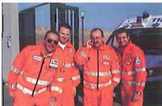
Una squadra del SerMolfetta SerMolfetta

Ogni weekend estivo, infatti, i volontari del SERMOLFETTA pattuglieranno la costa molfettese e garantiranno un pronto intervento sanitario in caso di necessità. Figure professionali qualificate assicureranno assistenza ai bagnanti in difficoltà a bordo di una moto e di un'automedica, per garantire la massima tempestività in caso di malori, traumi o sindromi da annegamento: casi in cui la velocità è tutto.