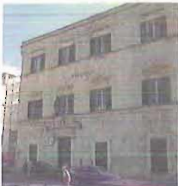
RUVO Il municipio

E conclude: «Se avessimo la bacchetta magica, la useremmo senza pensarci due volte. Molte volte ci sentiamo impotenti di fronte alla mole di richieste che riceviamo. Le risorse di bilancio stanziare per gli interventi sociali ci sono e sono cospicue, ma vista la situazione forse non appaiono sufficienti».