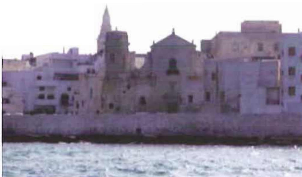
Chiesa di San Salvatore

È partita l'estate con l'Associazione Amici di San Salvatore: tanti appuntamenti e manifestazioni tra arte, cultura, musica e folklore che caratterizzeranno il quartiere e la Chiesa di San Salvatore, grazie anche alla collaborazione della Libreria Mondadori Chiarito e dell'Associazione Portavecchia.