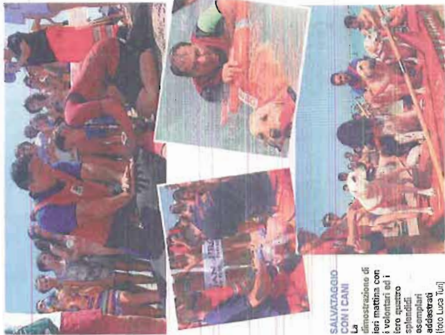
SALVATAGGIO CON I CANI La dimostrazione di ieri mattina con i volontari ed i loro quattro splendidi esemplari addestrati