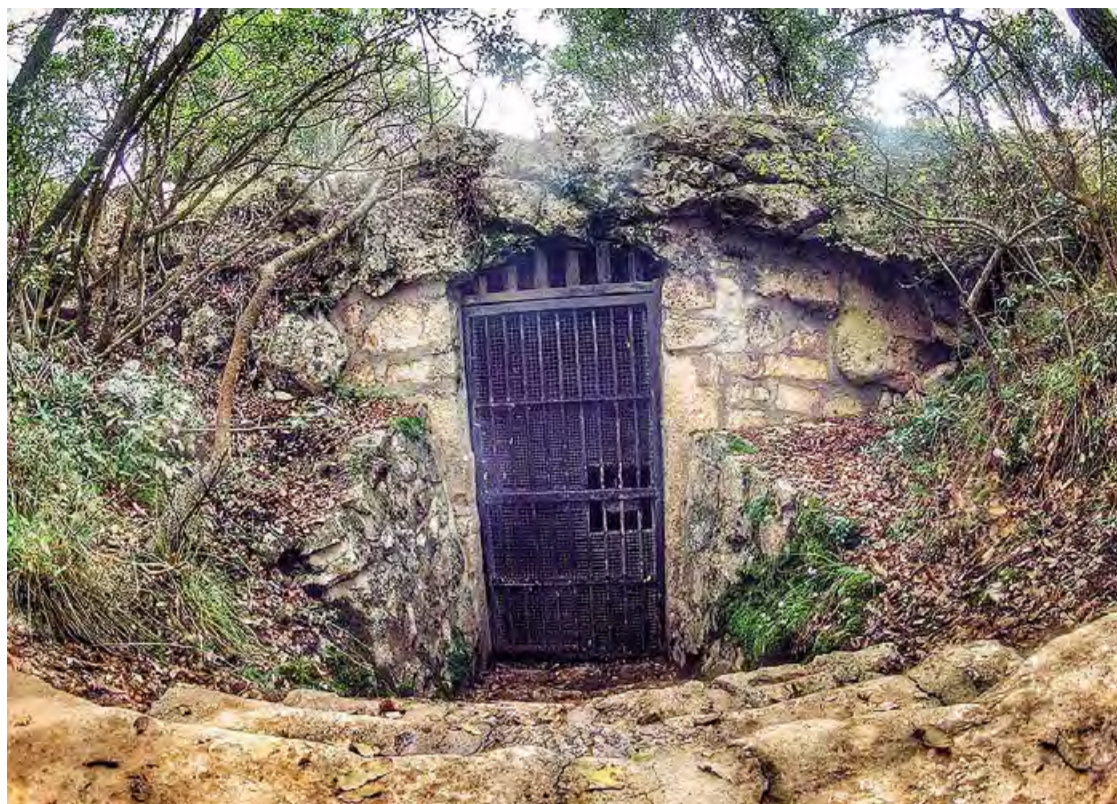
CASSANO Una immagine dell'imboccatura della «Grotta di Cristo»