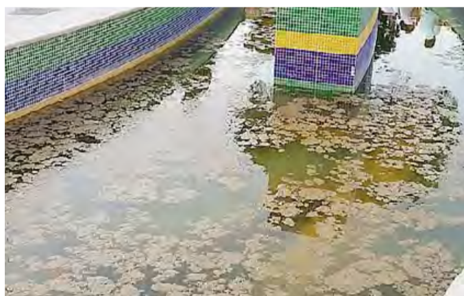
ZANZARE A NON FINIRE La melma che galleggia nella vasca