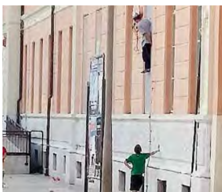
GIOCHI PERICOLOSI Il bimbo arrampicatore

L'INTERVISTA ATTUALMENTE IMPEGNATA NEL NAPOLETANO PER UNA GARA. DOMENICA TORNA A BARLETTA PER GLI ESAMI AL CAFIERO