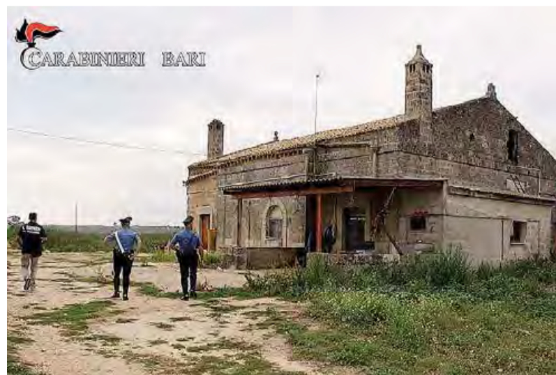
ALTAMURA La masseria che nascondeva la «catena di montaggio» della droga

Non poche punte di spillo emergono dalla sua storia. «Un altro gommista mi ha detto di rivolgermi a chi ripara le biciclette. Ma non posso pensare che lui non potesse sistemare la mia ruota. Ma come, lo fa per le macchine!», continua il ragazzo.