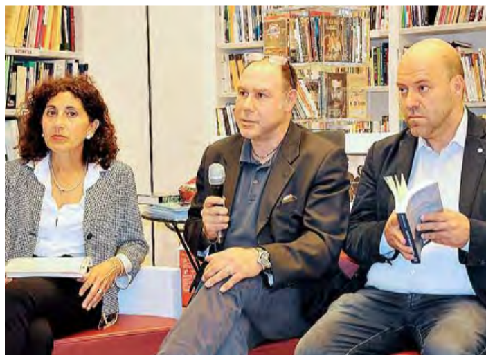
BARI Melpignano, del Castillo e Rossi

Ma al di là delle metafore alcuni dei personaggi del romanzo per qualcuno sono sin troppo riconoscibili, tanto da scatenare una piccola polemica al termine dell'incontro, per fortuna finita senza eccessivi strascichi.