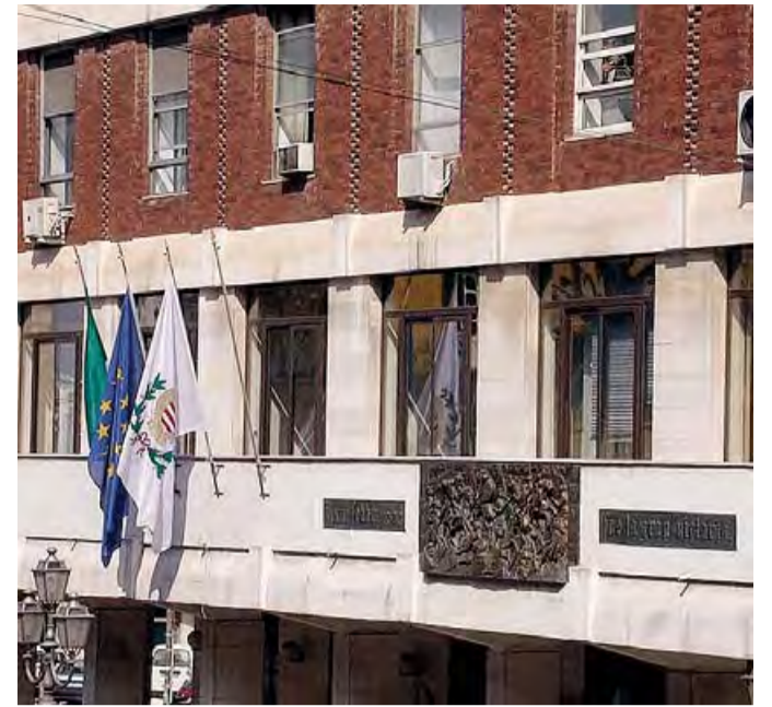
BARLETTA Palazzo di Città

La conclusione di Damiani: «Cosa significa? Che chi non ha più figli a carico, e quindi non potrà usufruire neanche di tale detrazione, si troverà a pagare lo stesso importo di un anno fa, se non maggiore. A subirne le conseguenze saranno soprattutto gli ultrasessantenni che con enormi sacrifici hanno realizzato nell'arco di una vita il sogno di un'abitazione in proprietà. Una politica incomprensibile e ingiustificabile, contro la quale il centrodestra ha lottato a gran voce e continuerà a farlo. Un accanimento di questo livello contro la proprietà immobiliare è assolutamente illogico, poiché in un momento di grave crisi economica non fa altro che deprimere i consumi e lo sviluppo, mentre la città chiede ossigeno proprio per ripartire.