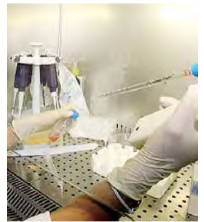
LA GIORNATA AIL Cure ematologiche

Altro appuntamento di rilievo, in programma il 18 giugno a Bologna, è la premiazione della quinta edizione di «Take... Action!», concorso per video maker non professionisti under 35 di tutta Italia. L'obiettivo dell'iniziativa è duplice: favorire l'inserimento di giovani artisti e creativi nei settori della comunicazione e dell'audiovisivo e ottenere strumenti che possano aiutare AIL a promuovere il proprio impegno nella lotta contro i tumori del sangue. Testimonial e Presidente di giuria è quest'anno il regista Ferzan Ozpetek. Supporta l'iniziativa anche il cantautore Samuele Bersani.