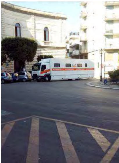
Andria Autoemoteca AVIS in piazza Trieste e Trento

Si sarà tempo fino alle ore 12,00 di stamane per donare sange per il prossimo.