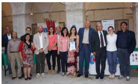
I premi dell'Avis per gli studenti e i donatori più assidui

Corato conta circa duemila donatori. Ieri l'Avis ha consegnato le borse di studio per gli studenti donatori e le benemeritenze per quelli più assidui