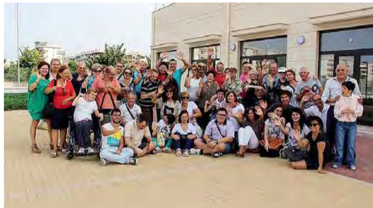
SOLIDARIETÀ La Casa Pegaso è stata eretta da pochi mesi in via san padre Kolbe. Per essere completata ha bisogno di fondi