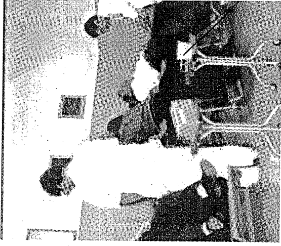
VOLONTARIATO Crescono i donatori di sangue

Intanto, domani dalle 8.30 alle 12 la Fidas gioiese ha organizzato presso l'ospedale di Gioia del Colle una giornata di donazione.