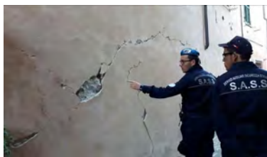
Volontari SASS impegnati a Muccia