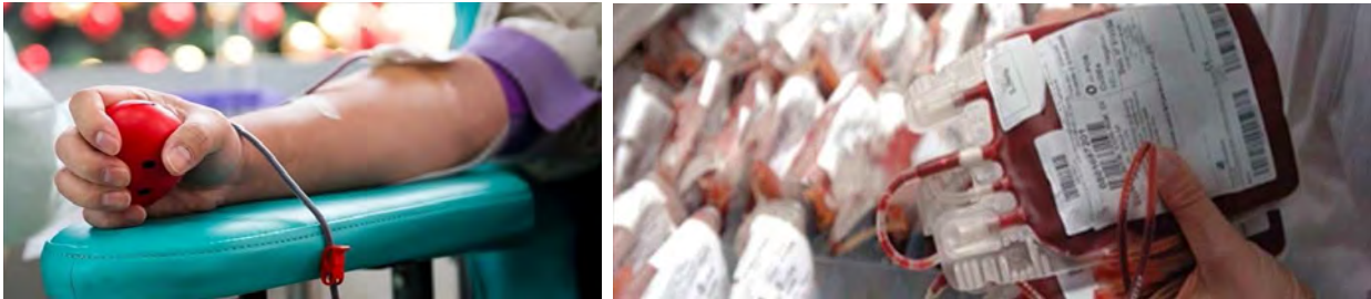
sacche sangue - centro trasfusionale

Si potrà donare dalle ore 8 alle ore 12 in piazza Moro, dove ad attendere i donatori ci sarà una autoemoteca