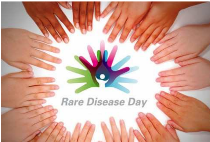
Giornata delle Malattie Rare

Organizzato da A.MA.R.A.M. Onlus in occasione della XI giornata mondiale delle Malattie Rare