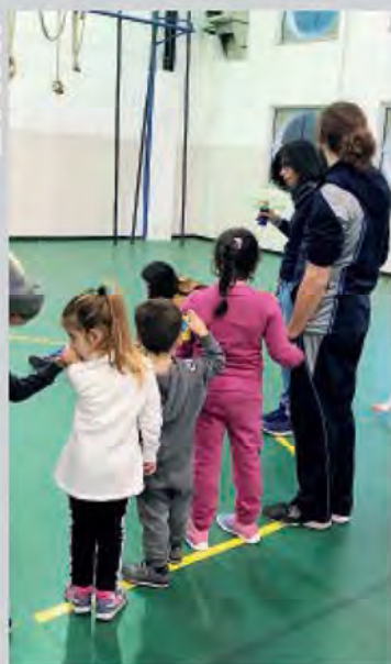
■ Un momento di gioco dei bimbi