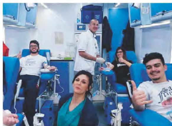
GIOIA Il momento di una donazione