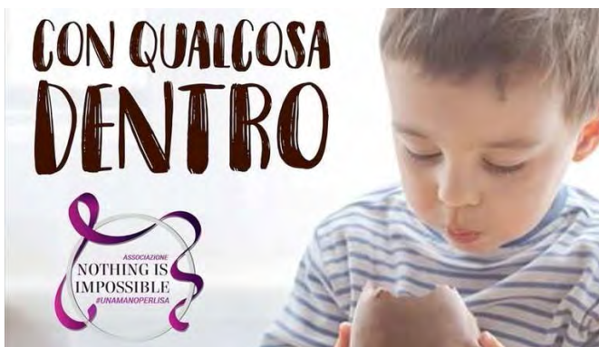
Sermolfetta, uova di Pasqua

Nelle uova di Pasqua del SerMolfetta, distribuite durante il periodo quaresimale e disponibili all'interno di molte aziende ed attività commerciali, non c'è solo una sorpresa, ma anche un gesto di umanità. Ecco spiegato - si legge in una nota - lo slogan "Le uova con qualcosa dentro": l'oggetto simbolico che le rende tali, ma soprattutto la buona azione.