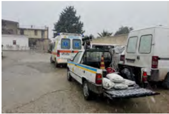
Emergenza neve Bat, l'impegno delle Misericordie