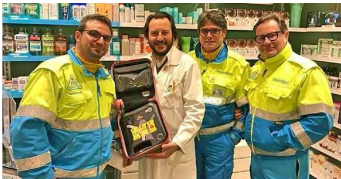
Nuovo defibrillatore donato alla 'Misericordia' Bitonto