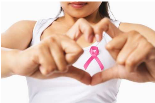
Tumore al seno