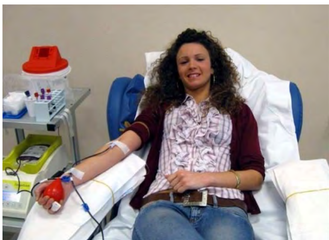
donazione del sangue

"Donare sangue è un atto volontario e non retribuito che fa appello al nostro senso civico di aiuto verso chi ne ha bisogno. Significa mettere a disposizione della collettività, degli altri, uno strumento di insostituibile solidarietà umana - scrive la sezione terlizzese "Immacolata" della Fidas in una nota -. "Donare il sangue inoltre permette di fare un check up gratuito, ridurre il livello di colesterolo e prevenire il rischio di malattie".