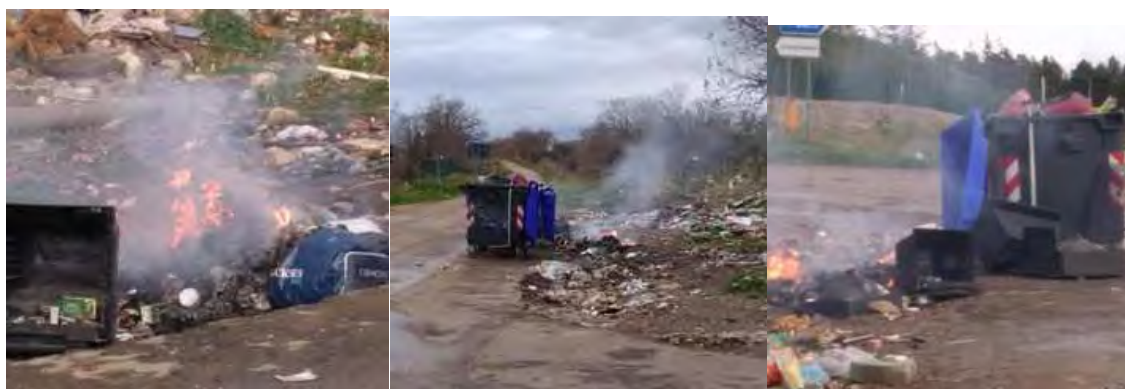
Rifiuti in fiamme

Nel pomeriggio dello scorso 7 marzo, intorno alle ore 16, durante il giro di ronda, i Volontari Federiciani si sono trovati di fronte ad uno scempio ambientale: qualcuno, infatti, ha pensato di dar fuoco ai rifiuti allocati sulla SP 174 del Reggio Tratturo.