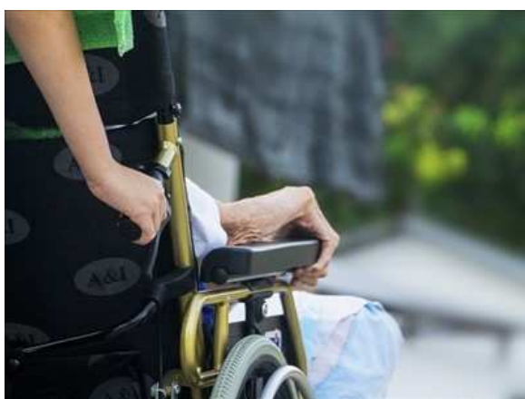
Malati di Sla e disabili senza assistenza

Martedì 15 maggio a Monopoli alle 16:30 nella biblioteca dei ragazzi. Alle 19:30 in piazza s. Antonio 22 con una tavola rotonda