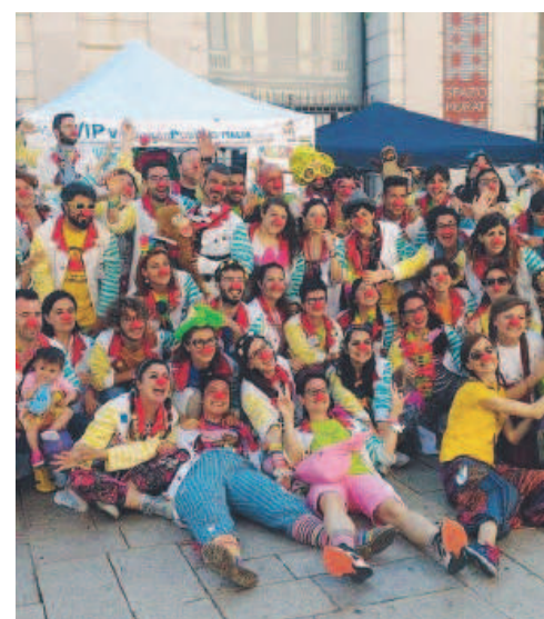
A BARI VECCHIA L'edizione del 2017

L'associazione, infatti, si occupa di promuovere e divulgare i valori della gioia e della solidarietà proprio attraverso la «terapia del sorriso», la clown-terapia appunto (ideata dal medico americano Patch Adams), considerata una sorta di «chiave universale» per riuscire ad attraversare le diverse situazioni di disagio e sofferenza. «Credo che il clown sia capace di vedere bellezza dappertutto - aggiunge Poppins - trovarla e regalarla a chi per qualche motivo ne vede poca».