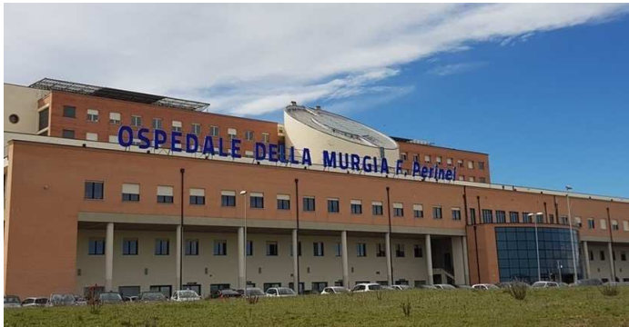
Ospedale della Murgia

L'Associazione “ M.I.Cro. Italia ODV ” nata nel 2013 per contribuire a migliorare l'attività di assistenza socio-sanitaria ai pazienti affetti da MICI, per promuovere e supportare l'attività di ricerca scientifica, informare la popolazione e rappresentare un canale privilegiato di comunicazione, e per fornire attività di supporto e di counseling psicologico, ha fatto sua questa richiesta partita dal basso, diventando una cassa di risonanza per le Istituzioni Mediche del territorio.