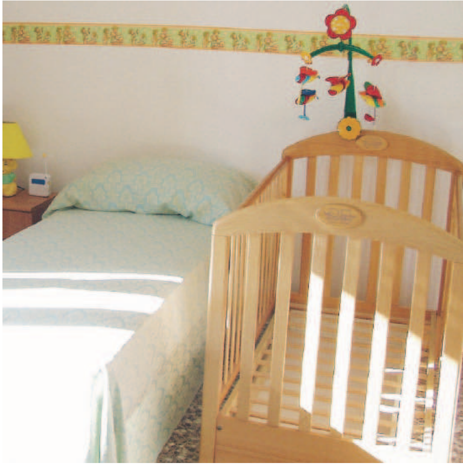
L'INIZIATIVA Sarà offerto e un omaggio alle gestanti e alle neo mamme