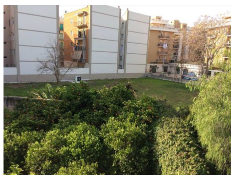
Villa Guastamacchia

Continua la crescita del centro polivalente di villa Guastamacchia. Riaperto dall'Amministrazione comunale ad ottobre del 2016 (dopo una lunga fase di lavori), il centro è stato progressivamente animato da molteplici attività ricreative al servizio degli utenti ed in particolare dei residenti del quartiere Stadio: nel corso di questo anno e mezzo sono state attivate la biblioteca di quartiere, l'orto sociale, la palestra, un gruppo teatrale e canoro.