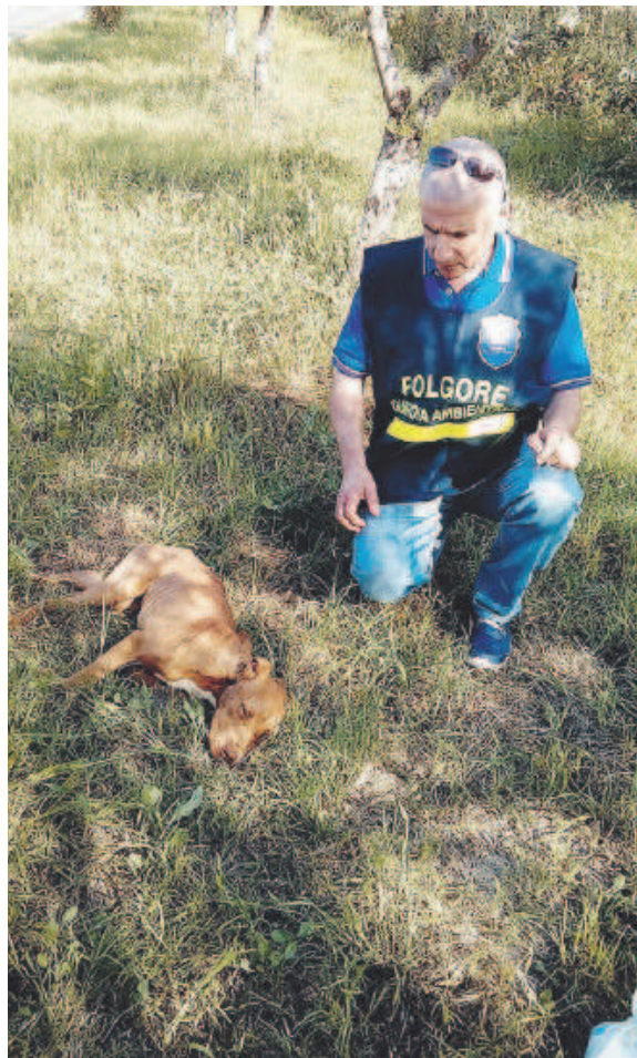
IL RITROVAMENTO È avvenuto a «Boccadoro»

TRANI I VOLONTARI DELL'ASSOCIAZIONE GUARDIA ECO AMBIENTALE «FOLGORE» AI MARGINI DELLA VECCHIA STRADA STATALE FRA TRANI E BARLETTA