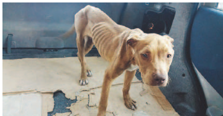
SALVO PER MIRACOLO Il cane trovato in fin di vita