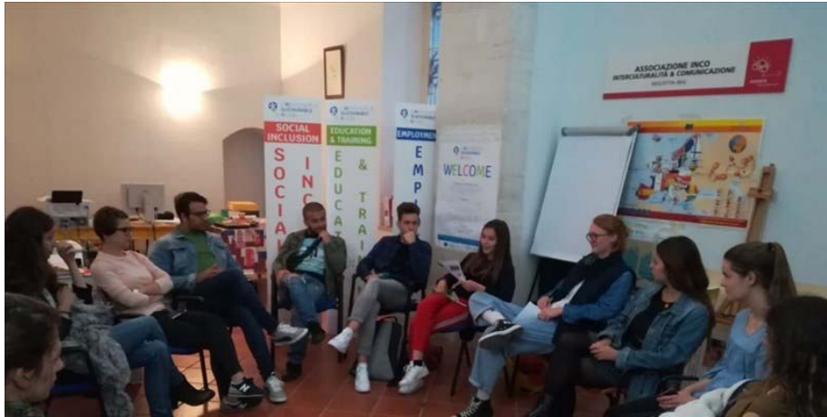
I volontari di Inco

L'evento è aperto alla cittadinanza, previa prenotazione, con utilizzo di mascherine e obbligo di distanziamento sociale