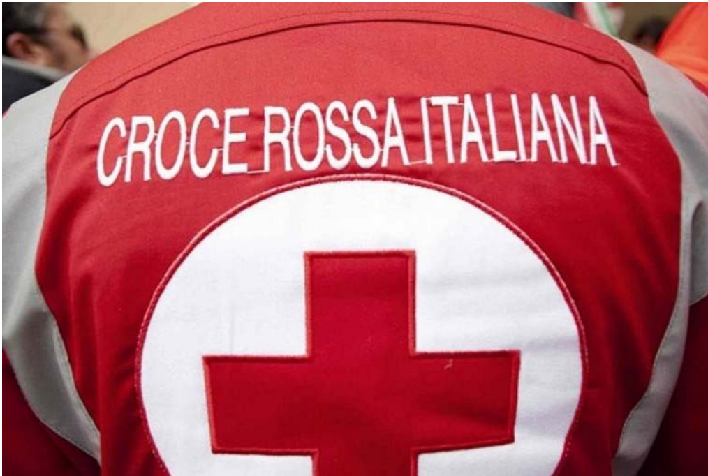
Croce rossa italiana