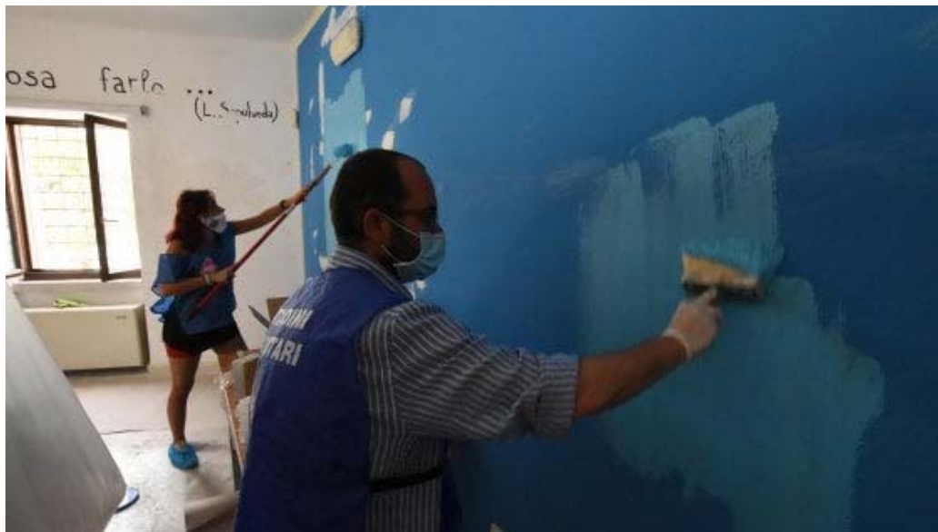
I volontari di Retake al lavoro

Hanno ritinteggiato i muri, aggiustato per quanto possibile i danni e ripulito gli spazi dell'Anspi che il 20 marzo avevano subito un'incursione: in azione i volontari di Retake e gli educatori di Chiccolino