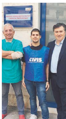
SANGUE L'Avis Canosa

Le visite si svolgeranno sabato 20 alle 18.30 e domenica 21 alle ore 10.30. L'incontro è presso la sede della Fondazione archeologica canosina in via Puglia 12 a Canosa di Puglia. «I partecipanti potranno anche gustare le prelibatezze culinarie presso i ristoranti convenzionati con la Fac» concludono gli organizzatori. Per info 3338856300