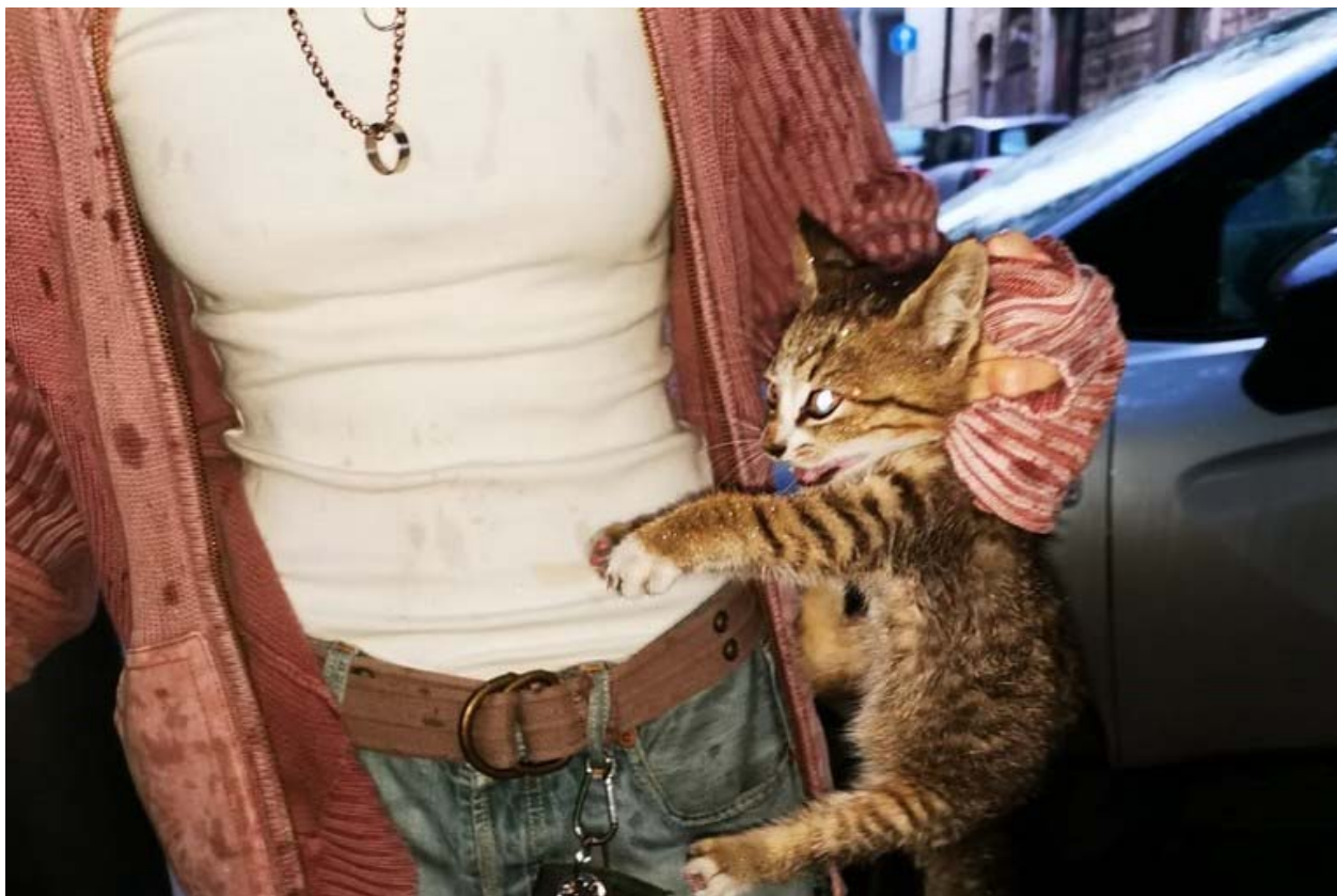
Il gattino salvato.

I soccorritori lo hanno poi affidato all'ANPANA