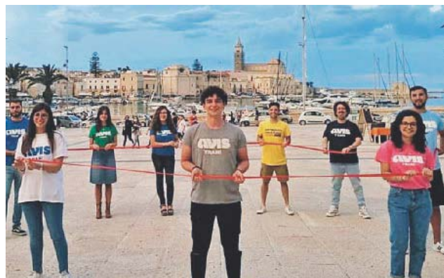
SANGUE È VITA | giovani donatori Avis

● TRANI. E' stato un bel momento di impegno civile quello che si è concretizzato ieri mattina a Trani durante la messa in cattedrale con tutte le Avis comunali della provincia Bat per celebrare la Giornata mondiale del donatore di sangue istituita nel 2004 dall'Organizzazione Mondiale della Sanità per ricordare la nascita avvenuta il 14 giugno del 1868 di Karl Ernest Landsteiner - biologo e fisiologo austriaco naturalizzato statunitense - che 1900 egli identificò dei gruppi sanguigni umani.