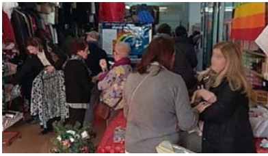
L'interno di Equanima

Equanima distribuisce i capi destinati a chi ha difficoltà economiche, raccolti attraverso le donazioni. "Abbiamo bisogno di volontari più giovani e di uno spazio adeguato"