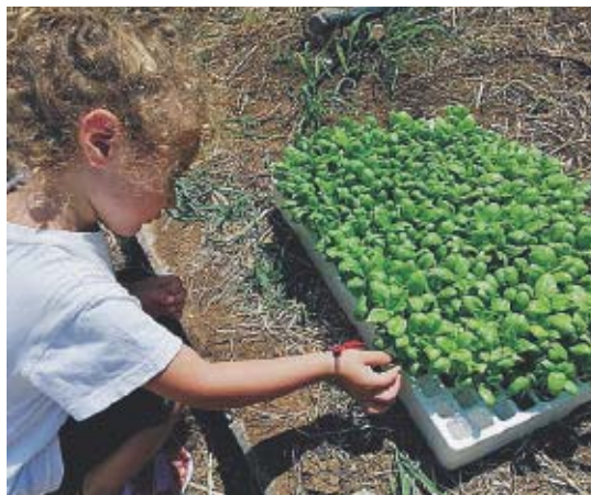
ATTIVITÀ Bambini impegnati

Tutti i volontari impegnati nel campo estivo hanno partecipato al corso formativo “Con la giusta cura”, da un'idea della Confederazione Nazionale delle Misericordie che ha permesso di formare proprio i nuovi animatori educativi anche alla luce delle stringenti regole imposte dall'emergenza sanitaria. Divertimento e svago ma con un occhio rivolto ai temi della protezione civile, del primo soccorso, dell'ambiente, della solidarietà e dell'altruismo. Il titolo scelto per il progetto è “Ripiantiamo... da qui”, dunque ripartire dall'arte di prendersi cura dell'altro e della natura con una