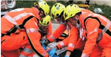
volontari Anpas Puglia

Il presidente del comitato regionale dell'Anpas: «Si spera che anche questa volta la politica non abbia riservato agli operatori l'ennesima presa in giro»