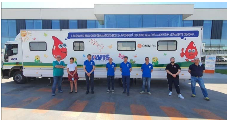
Avis e CMAlifts, insieme per una mattinata di donazione © CMAlifts

Collaborazione tesa ad incrementare il numero di donatori, in netto calo da marzo a maggio ma adesso nuovo in crescita