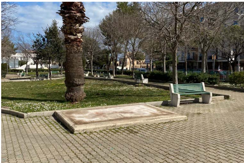
Giardini di via Leonardo da Vinci