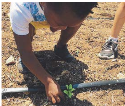
PIANTUMAZIONE Un momento dell'attività

particolare attenzione dedicata proprio all'orto didattica. Un approccio innovativo che ha tra gli scopi quello di trasmettere valori importanti come la responsabilità delle proprie azioni, la tutela dell'ambiente ed il rispetto della natura. [m.pas.]