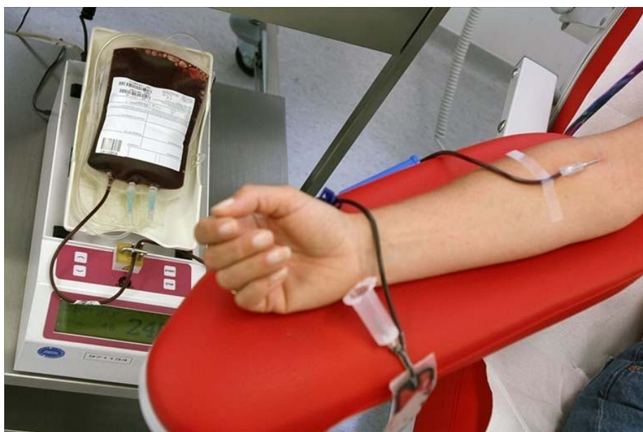
Donazione di sangue

Chiunque vorrà donare dovrà necessariamente procedere a prenotazione chiamando o mandando un messaggio whatsapp al numero 3395257555 per permettere ai volontari di poter operare in sicurezza