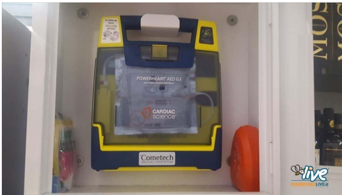
Defibrillatore in villa Faro

Lo strumento salvavita presentava la mancanza delle placche oramai scadute e la batteria scarica