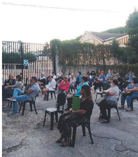
ANDRIA La riunione dei genitori dei ragazzi disabili