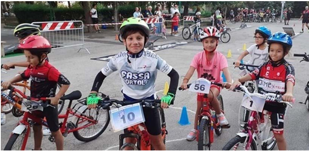
Pedalando insieme verso una nuova "cultura della mobilità" nelle città.

Dopo il grandissimo successo delle prime quattro giornate, l'Associazione ORME Bike, richiama i giovani della città a partecipare al progetto "BICI IN CITTÀ" del programma PUMS-IperUrbano 2020 del Comune di Altamura.