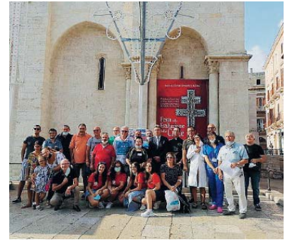
BONTÀ I donatori durante la Festa del Legno della Croce

«Dal 1° giugno al 31 agosto ci sono state 975 donazioni»