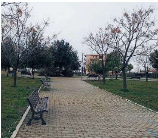
CANOSA Il parco «Madonna della Pace»

Sarà dato il via al progetto «Scatta e mappa», che coinvolgerà tutti i cittadini che vorranno segnalare i luoghi ricettacolo di rifiuti, per migliorare la qualità dell'ambiente. Venerdì, per rispettare le regole anticovid solo un gruppo di massimo trenta persone potrà prendere parte alla iniziativa. «Un numero