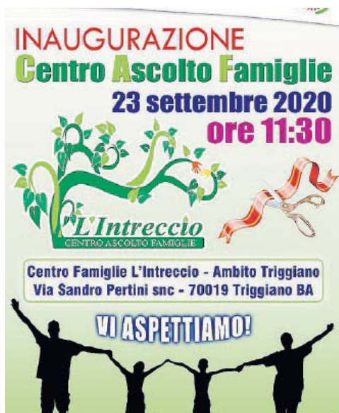
TRIGGIANO Domani l'inaugurazione del Centro