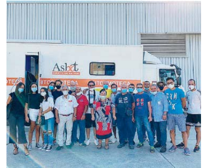
STILE DI VITA La foto di gruppo alla Cementeria