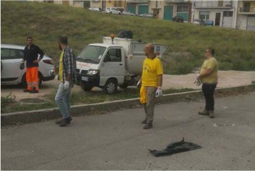
Legambiente Andria: "Puliamo il Mondo" iniziativa domenica 24 settembre