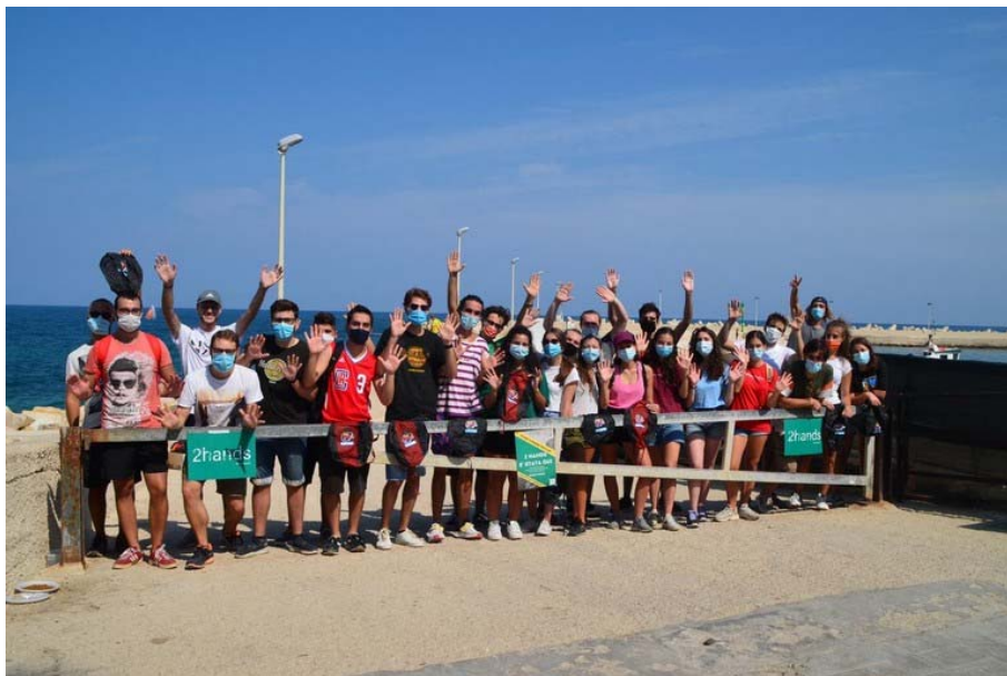
World Cleanup Day